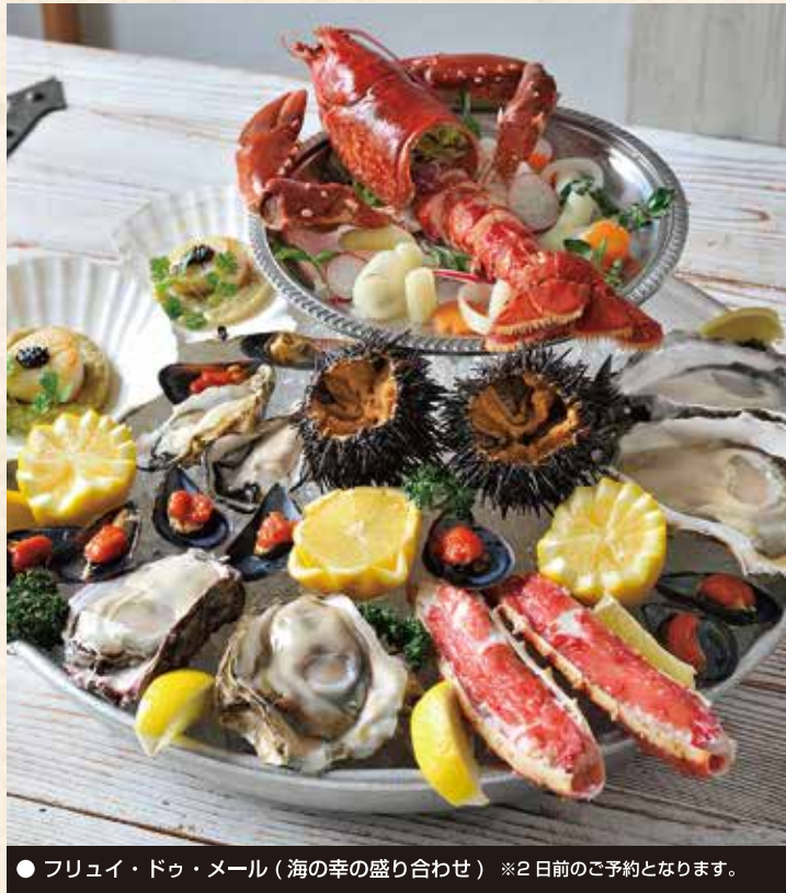
● フリュイ・ドゥ・メール（海の幸の盛り合わせ）※2日前のご予約となります。

当店だけでしか、ご賞味できない直輸入のフレッシュオイスター&シーフード！ 美味しさと安全性を最重視して世界中の海から空を飛んで東京オイスターバー白金店に到着いたします。