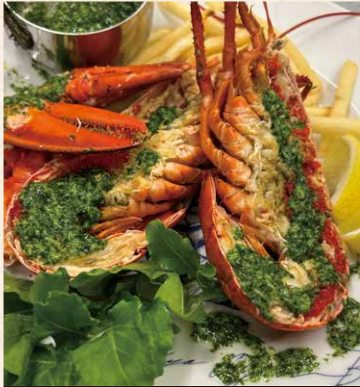
● オマール海老のハーブバターソース